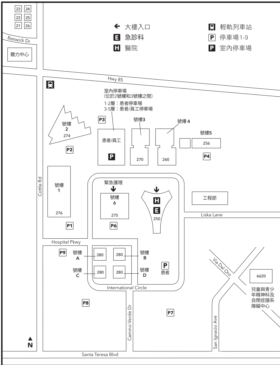
地圖未按實際比例繪製

250 Hospital Parkway, San Jose, CA 95119